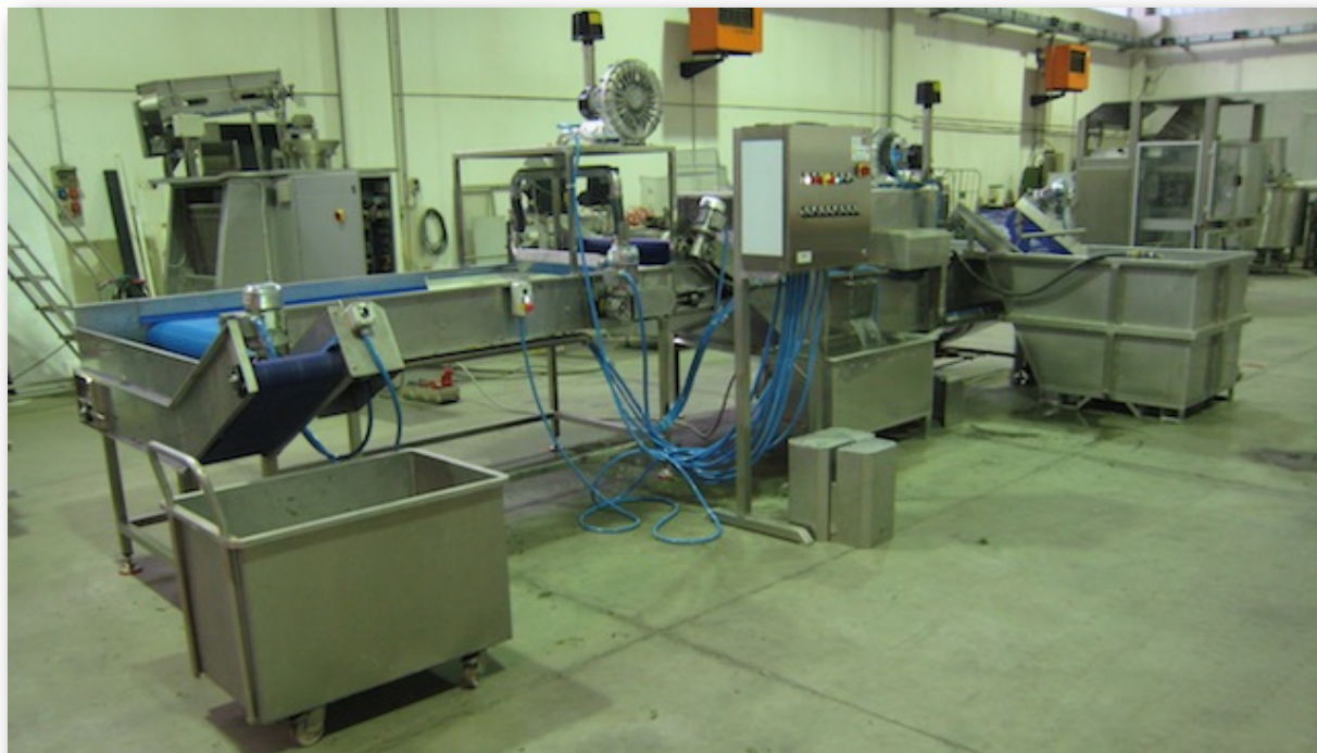
Gesamtansicht, ca. 7 - 8,5 m lang, je nach Aufstellung

Alle Maschinen werden nach Kundenbedürfnis hergestellt