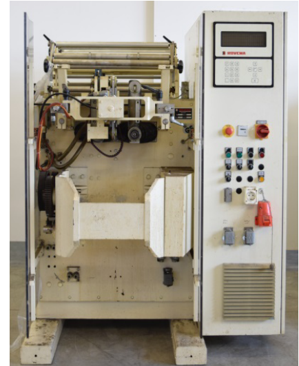
ROVEMA VPR 250 vorher

→ Ausstattung mit Applikationen gemäß Kundenwunsch