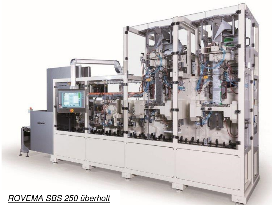
ROVEMA SBS 250 überholt