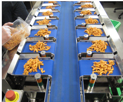
Bsp. mit schmalem Austragsband