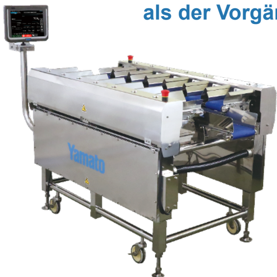
Bild: Yamato TSD-N314WS-FP - Standard Typ

Noch besser , noch schneller , noch hygienischer als der Vorgänger, Typ TSDW-206W !