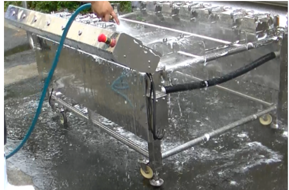
Bild: einfache und schnelle Reinigung