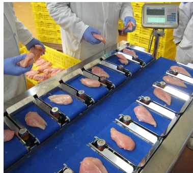
Bsp. mit breitem Austragsband