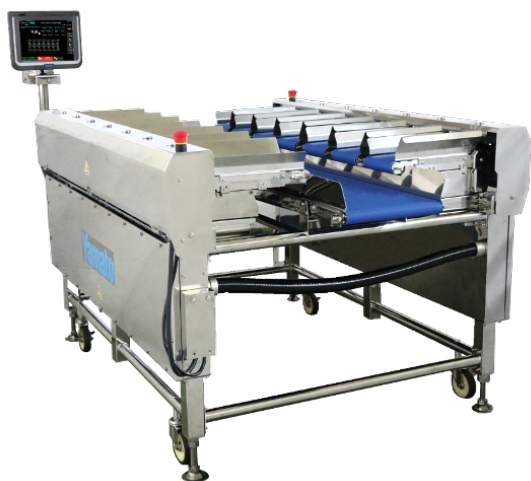
Bild: Yamato TSD-N314WL-FP - L-Typ / Gross