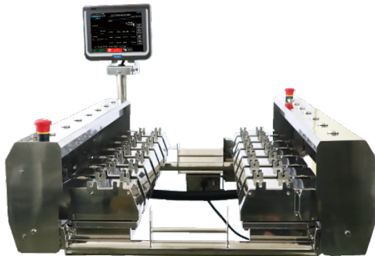
Bild: Yamato TSD-N3 nach Ausbau der Wiegebänder

Die verbesserte Konstruktion erlaubt eine einfache und schnelle Reinigung: