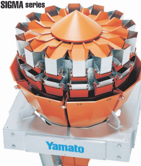
YAMATO DATAWEIGH® ADW-514SV